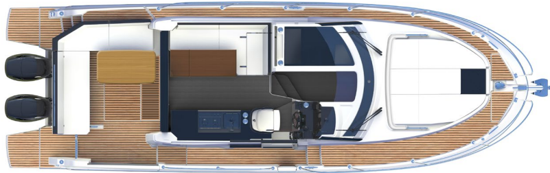
MAIN DECK PONT PRINCIPAL